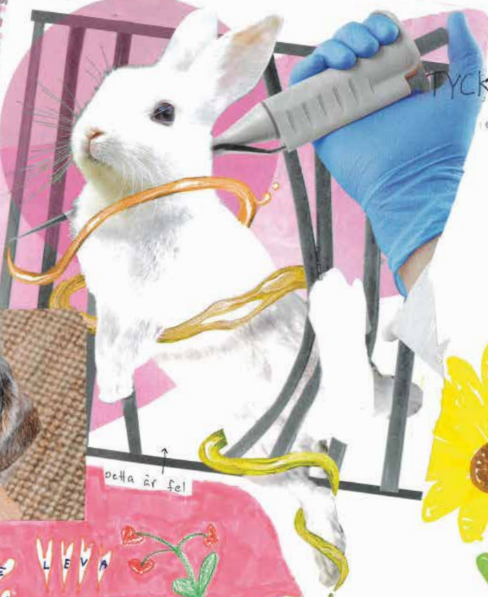
↑ detta är fel