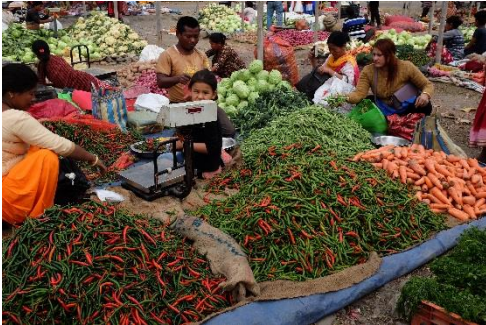
Bild 9. Grönsakstorg. Den viktigaste näringsverksamheten i Nepal är jordbruket, där till och med 2/3 av befolkningen arbetar. Även barn och unga är med i jordbruksarbetet och i införskaffandet av familjens levebröd. Barn och unga hjälper bland annat till ute på odlingarna eller med att sälja grödorna, så som grönsaker, linser eller kryddor på torget.