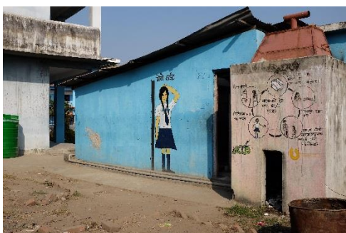
Bild 3. Flickornas toalett. Elevkåren har tillsammans med skolkommittén byggt en skild toalett för flickor på skolgården, så att flickor slipper bli bort från skolan när de har mens. Elevkårerna sprider också bättre information och bryter och tabu om mens bland eleverna och lärarna.

Bild 2. Medlemmarna i en elevkårsstyrelse planterar växter på sin skolgård. Elevkårerna i Nepal deltar aktivt i arbetet för att främja ungas välmående och utveckla skolmiljön. Den här skolans elevkårsstyrelse har utöver trädgården även arbetat för att skolan fått skilda toaletter för flickor och vattenrengöringsmaskiner till klassrummen.