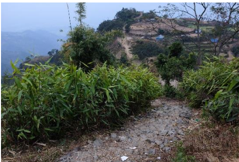
Bild 5. Skolväg. Nepal är ett ytterst bergigt land. Ungdomarna från de små bergsbyarna får ofta gå till fots till och med 1–2 timmar varje dag för att komma till skolan. Terrängen kan ofta vara utmanande då ett fungerande vägnätverk inte finns. I bilden syns de stentrappor som leder till skolgården.