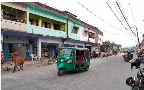
Bild 6. Gatubild från Dhulabaris småstad. Dhulabari är beläget i östra Nepal, ca en halv timme från gränsen till Indien. Motorcyklar, skotrar och mopedtaxi är vanliga fordon.