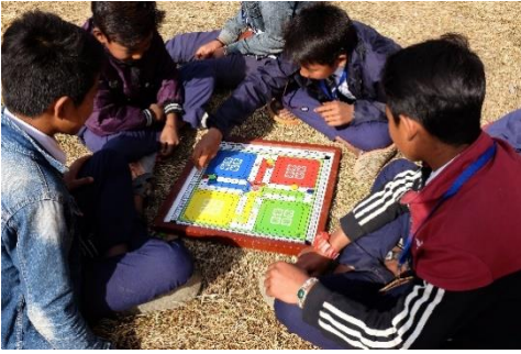
Bild 11. Pojkarna spelar ett brädspel som heter Ludo på rasten. Ludo påminner om det i Finland populära spelet Kimble. Andra populära lekar under rasterna är bland annat att hoppa twist, spela volleyboll, brännboll och att göra trix med en slags fotbagg-boll som bundits ihop med gummiband.