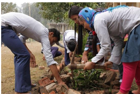
Bild 2. Medlemmarna i en elevkårsstyrelse planterar växter på sin skolgård. Elevkårerna i Nepal deltar aktivt i arbetet för att främja ungas välmående och utveckla skolmiljön. Den här skolans elevkårsstyrelse har utöver trädgården även arbetat för att skolan fått skilda toaletter för flickor och vattenrengöringsmaskiner till klassrummen.

Bild 1. Himalayas berg fotograferade från utkanten av Nepals huvudstad Kathmandu. Den högsta toppen ligger vid 8848 meter. Mount Everest ligger vid gränsen mellan Nepal och Tibet. Några av världens stridaste floder har sin början i Himalaya, och området hör till de bördigaste jordbruksområdena som finns.