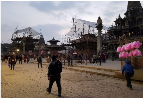
Bild 10. Durbaris torg i Kathmandu. Torget består av en imponerande samling forntida palats, tempel och trädgårdsområden. Tidigare var Durbaris torg centrum för stadens maktelit, även kungarna bodde här. Nuförtiden är det en livlig mötesplats för lokalbefolkningen. De ljusröda påsarna är sockervadd. År 2015 drabbades Nepal av två enorma jordbävningar som ledde till att tusentals människor miste livet och hundratusentals byggnader rasade eller tog skada. I bilden syns byggarbetsplatser där gamla tempel restaureras.