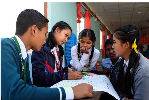
Bild 7. Fyra skolors elevkårsstyrelser samlas i skolans festsal. De deltar i en workshop som behandlar utmaningar som unga ställs inför och hur de kan lösas. Elevkårerna vill främja ungas välmående genom att uppmuntra unga att berätta om utmaningar de stött på och genom att meddela vuxna om det stöd som unga behöver.