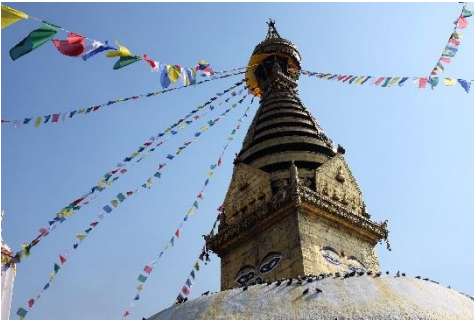
Bild 12. Swayambhunatis tempel i Kathmandu, som också är känt som "Monkey tempel" efter alla hundratals tama apor som bor i området. Det finns flera tempel i området och de besöks av tusentals lokala och utländska turister dagligen. Nepals största religioner är hinduism (över 80 % av befolkningen), buddhism (9 %) och muslimer (4,4 %). Religion, speciellt hinduism och buddhism, är starkt närvarande i Nepal.