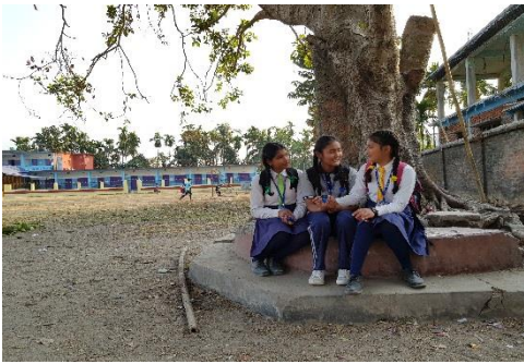
Bild 4. Högstadiel elever sitter och pratar på skolgården efter lektionen. I bakgrunden syns en av Dhulabari-skolans byggnader. Skolan har sammanlagt 2114 elever.